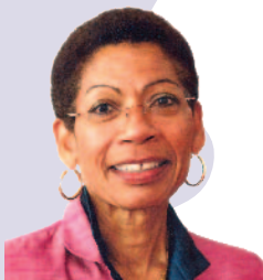
George Pau-Langevin Ministre déléguée à la réussite éducative