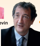
François Lamy Ministre délégué chargé de la ville