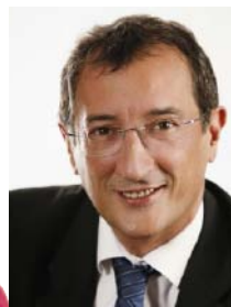
François Lamy Ministre délégué chargé de la ville

Si nous avons souhaité vous réunir aujourd'hui, c'est parce que nous considérons que la réussite éducative se définit avant tout par la diversité des acteurs qui y concourent et qui agissent au quotidien afin de construire le parcours des enfants, notamment des plus défavorisés.