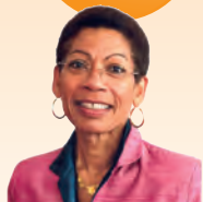
George Pau-Langevin Ministre déléguée à la réussite éducative