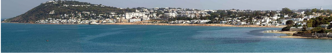
منظر شامل لمدينة المرسى

تقع مدينة المرسى على بعد 18 كم من تونس العاصمة وعلى بعد 10 كم من مطار تونس قرطاج الدولي