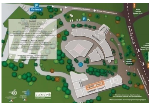
DSDEN 06 sur le site du Rectorat de Nice

www.ac-nice.fr/ia-06/ 53, Avenue Cap de Croix 06181 Nice cedex 2 Tél : 04 93 72 64 50 Email : 06scol2@ac-nice.fr