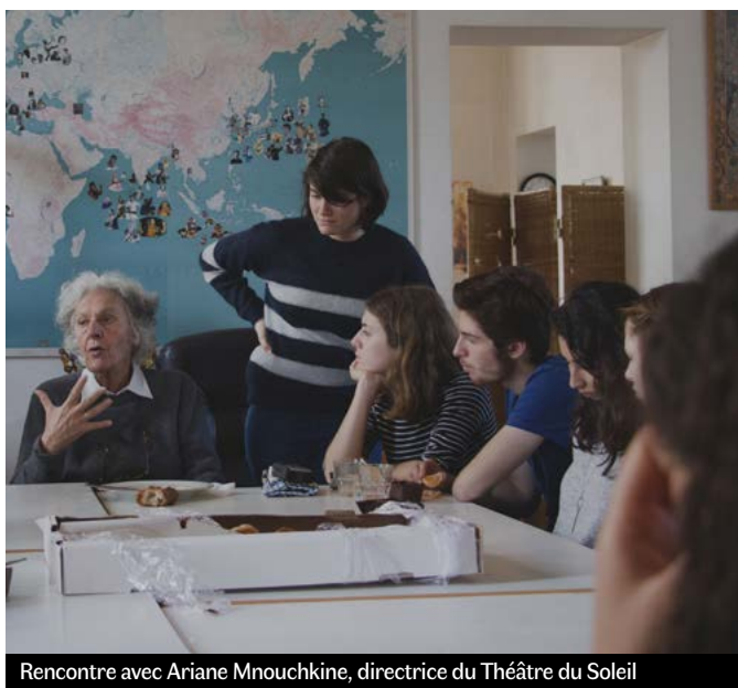
Rencontre avec Ariane Mnouchkine, directrice du Théâtre du Soleil