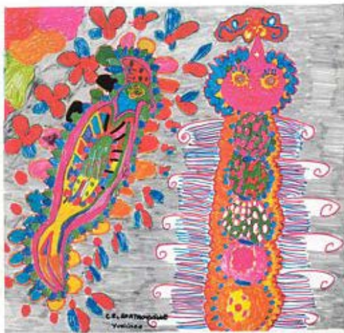
Dessin d'enfant réalisé dans le cadre du projet L'arbre sorcier, Jérôme et la tortue

avec la création des classes à projet artistique et culturel, première grande étape vers la généralisation, ont permis de formidables avancées et la construction de partenariats forts et durables entre établissements scolaires et établissements culturels. Un vrai réseau s'est ainsi construit depuis trente ans.