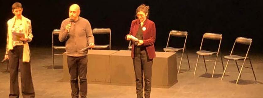
Ouverture (Direction du CDN - Sylvain Maurice / Direction des affaires culturelles d'Ile-de-France - Nicole Da Costa / Rectorat de Versailles - Marianne Calvayrac)

par la direction du CDN, la direction des affaires culturelles d'Ile-de-France et l'Académie de Versailles