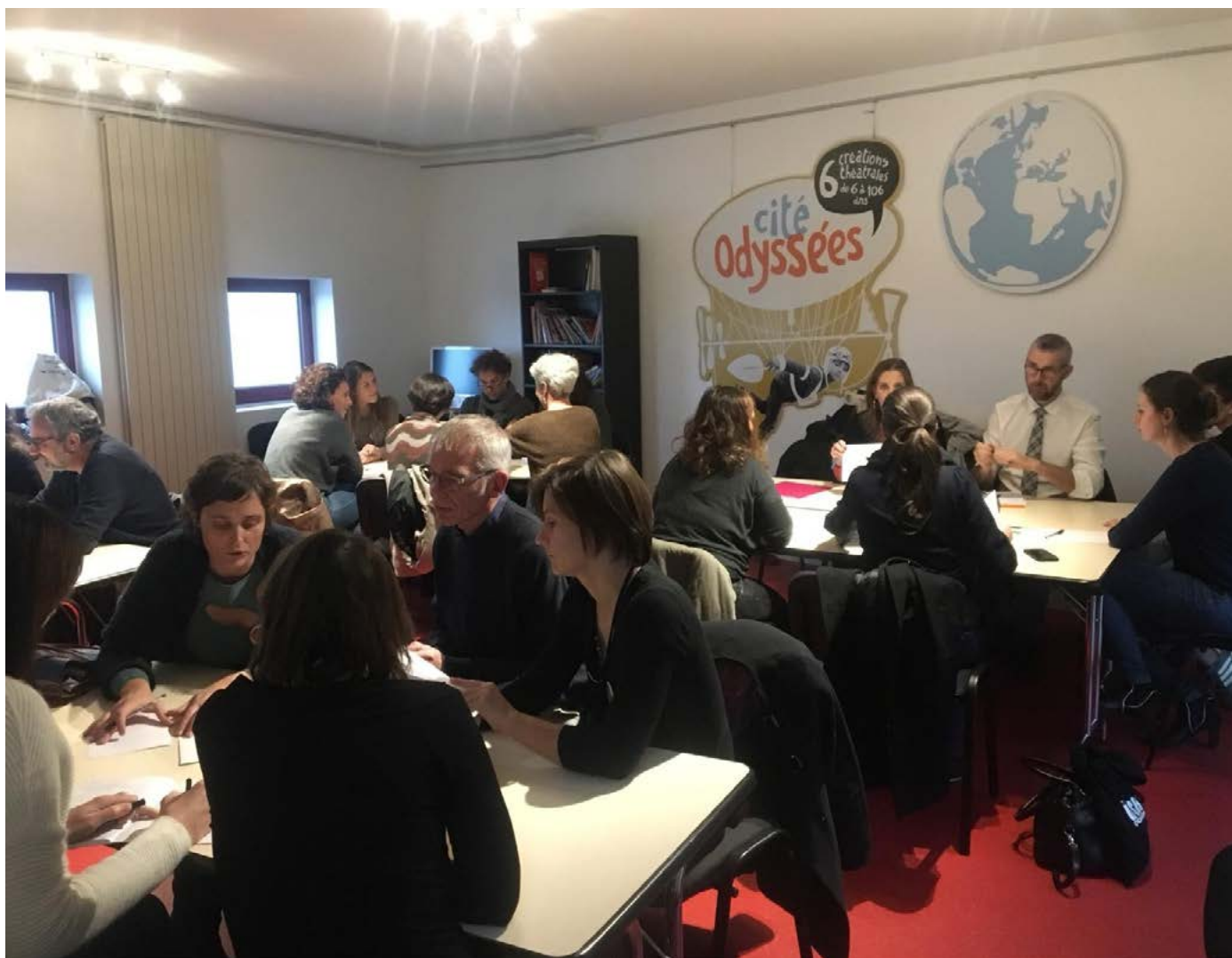
Atelier de travail sur la thématique de la médiation.