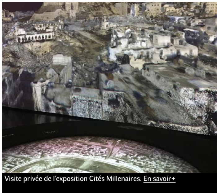
Visite privée de l'exposition Cités Millénaires. En savoir+