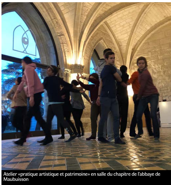
Atelier «pratique artistique et patrimoine» en salle du chapitre de l'abbaye de Maubuisson

sailles, la DRAC Île de France et le Conseil Départemental du Val d'Oise. Au cœur de l'édifice historique, apports théoriques et ateliers de pratique artistique ont permis de questionner la manière dont les esprits se nourrissent de la pierre, mais aussi de mieux saisir comment, grâce au regard de l'artiste, les élèves peuvent s'appropriier le patrimoine qui les entoure, qu'il soit matériel ou immatériel, séculaire ou contemporain.