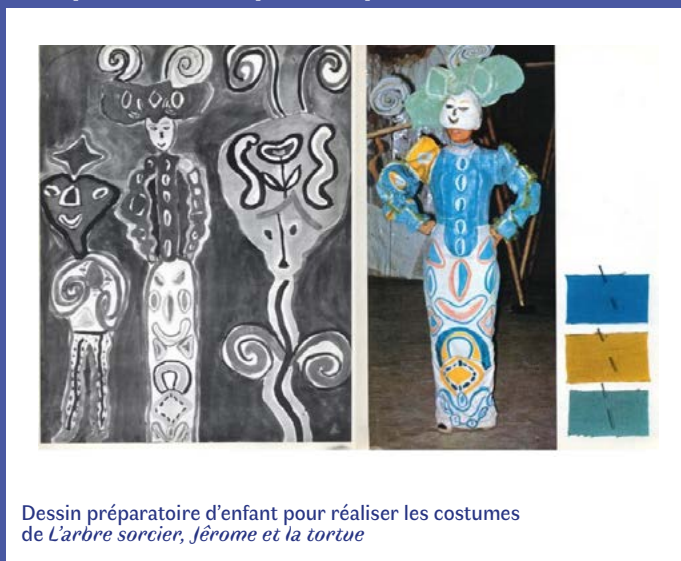
Dessin préparatoire d'enfant pour réaliser les costumes de L'arbre sorcier, Jérôme et la tortue