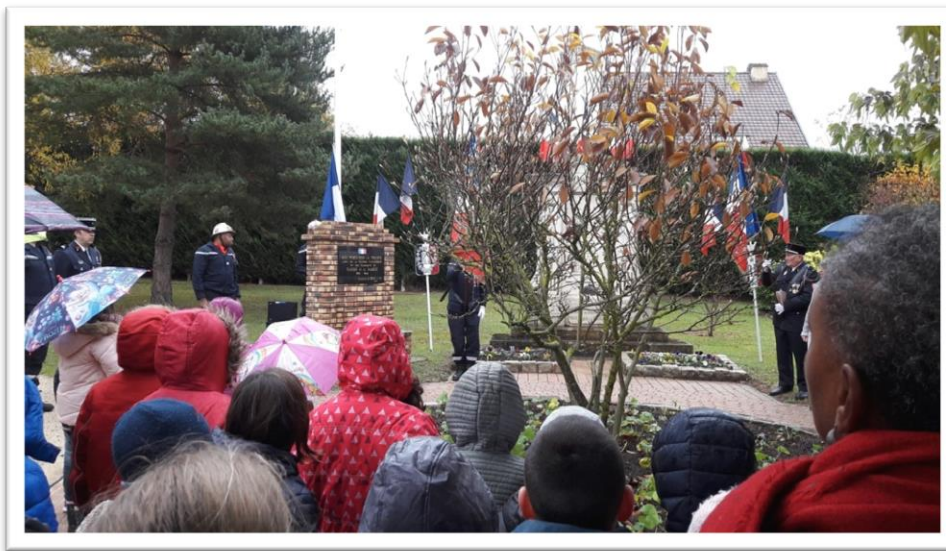
Participation à la cérémonie au monument aux morts

Nous avons participé aux cérémonies de commémoration du 11 novembre dans notre village.