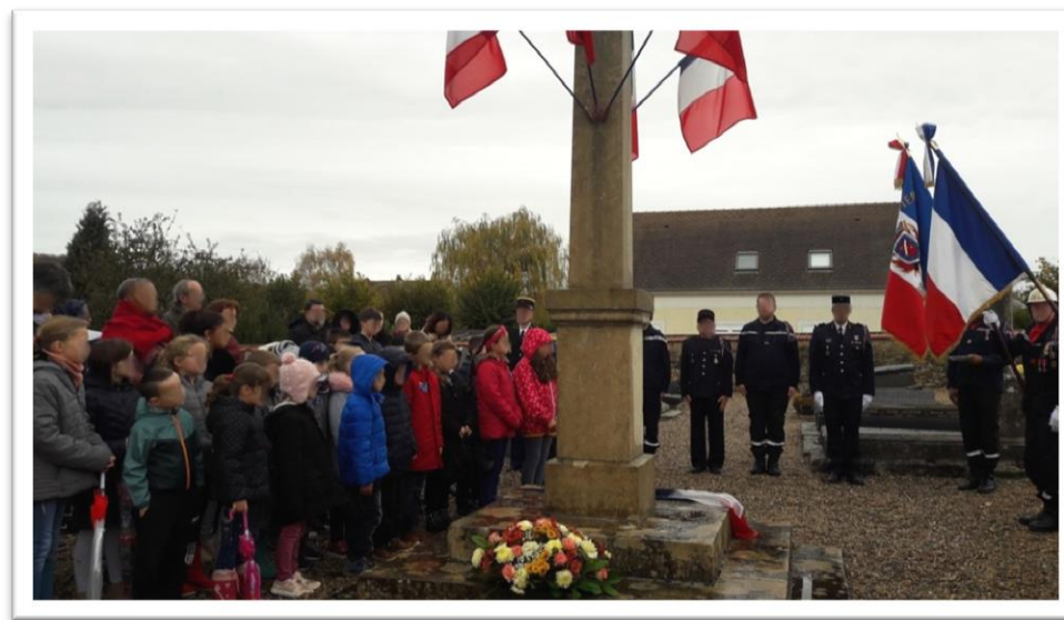
Participation à la cérémonie au cimetière et interprétation de la Marseillaise

Pour préparer cela, nous avons travaillé toute la première semaine après les vacances de la Toussaint sur l'importance de cet évènement.