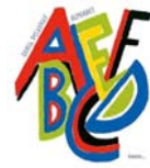
Sonia Delaunay, Abécédaire sur les comptines de Jacques Damase édité en 1972