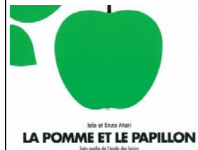
La pomme et le papillon, Iela et Enzo Mari, Paris, école des Loisirs, 1970