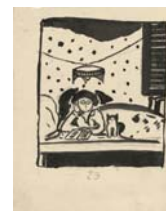
Balthus (Balthasar Klossowski)