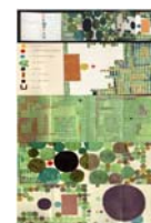
Le petit Chaperon rouge , Warja Lavater, 1965