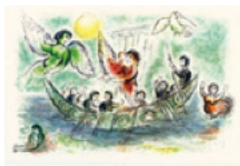
Marc Chagall, Ulysse et les Sirènes , 1974-1975, Lithographie pour l'Odyssee BNF, réserve des livres rares.