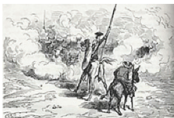
Gustave Doré, Don Quichotte , Gravure, 1863.