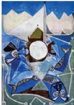
Pablo Picasso, Ulysse et les sirènes , 1947, Musée Picasso d'Antibes.