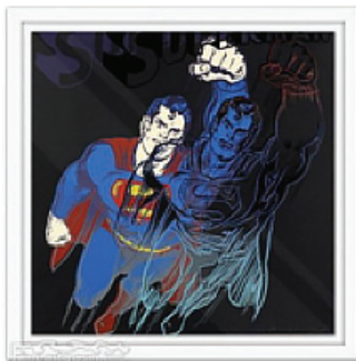
Andy Warhol, Superman 1981.