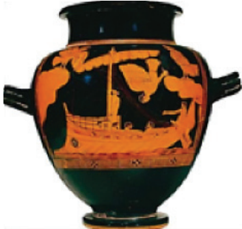
Peinture sur poterie, «Ulysse et les sirènes», 475 avant J.C. Céramique, hauteur 32,2cm, British Museum, Londres.