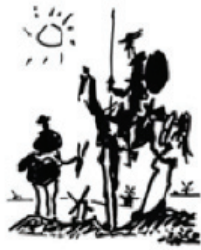
Pablo Picasso, Don Quichotte , 1955.