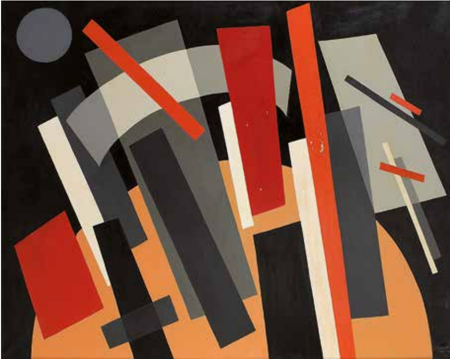
Evol de formes géométriques II 1924/1968 Huile sur toile 116 x 148 cm