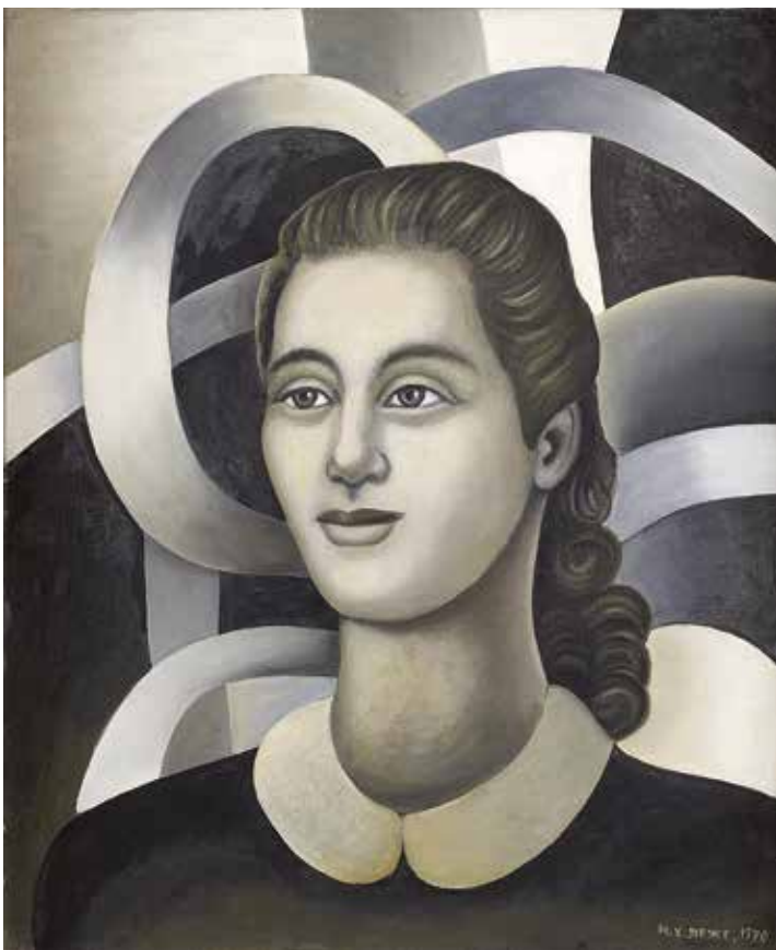
Portrait de Wanda 1970 huile sur toile 65 x 54 cm