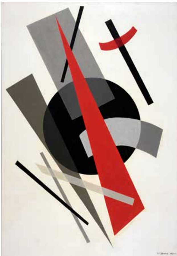
Mouvement sur la lune 1921/1968 Huile sur toile 132 x 91 cm