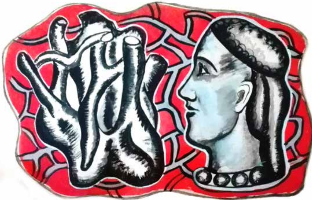
Autoportrait de Nadia - Gouache