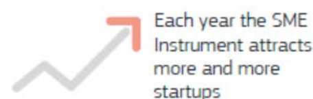
Age of SMEs by year of application