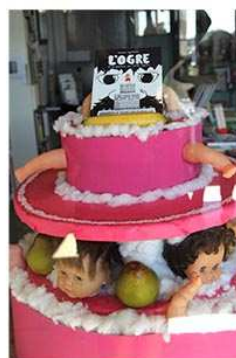
L'ogre et la princesse aux petits oignons , Sabrina Inghilterra, Didier jeunesse, 2015