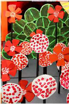
L'oiseau de feu , Charlotte Gastaut, Editions amaterra, 2014