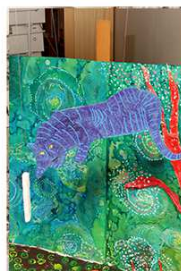
MOABI, EL FATHI, LA PALISSADE, 2015