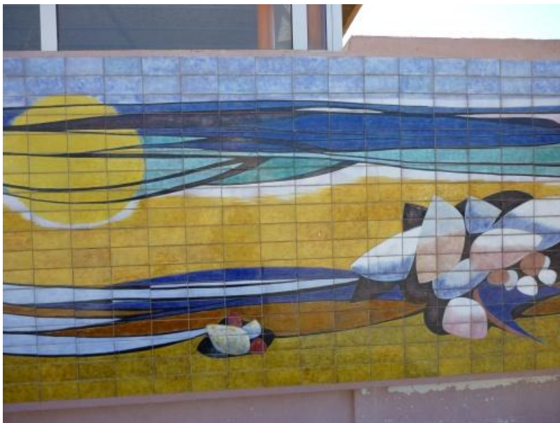
Photographie école Port-la-Nouvelle

Mosaïque de Jean Camberoque, Ecole André Pic Port-la-Nouvelle, réalisée pour l'inauguration de l'école en septembre 1970.