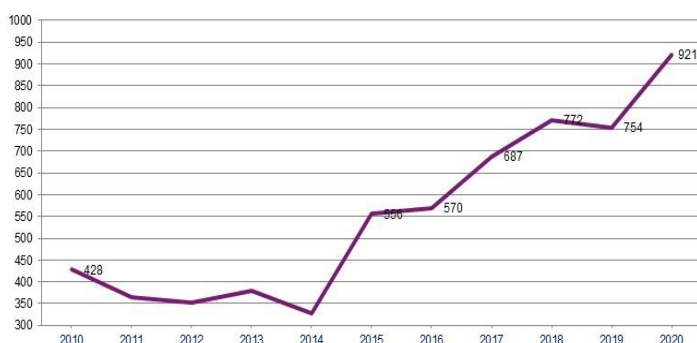
Graphique 4 : évolution des effectifs du secteur privé hors contrat

entre 2019 et 2020 (+108 élèves, soit +8,4 %). Les effectifs des «3 ans» enregistrent une forte hausse de 23% (+81 élèves). Ceux des «4 ans » accusent une baisse de 2,1% (- 8 élèves). Le niveau de «2 ans » affiche une augmentation (+5,8 %). Le niveau « 5 ans et plus » enregistre une hausse de 6,6 %(+26 élèves).