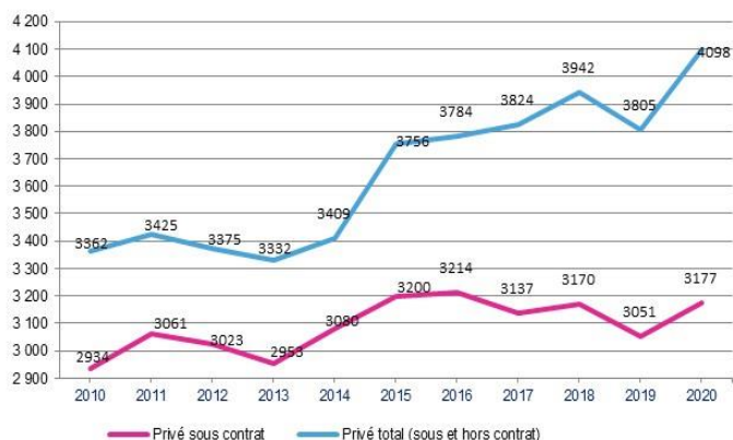
Graphique 3 : évolution des effectifs du secteur privé

Les effectifs du secteur privé ont augmenté de 21% entre 2010 et 2020, soit 736 élèves en plus (cf. graphique 3). Quant au secteur privé hors contrat, il enregistre une hausse de 493 élèves sur la période 2010-2020 (cf.