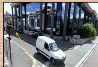
accès C.I.O. au fond de l'impasse

Du lundi au vendredi 9h00 - 12h30 13h30 - 17h00