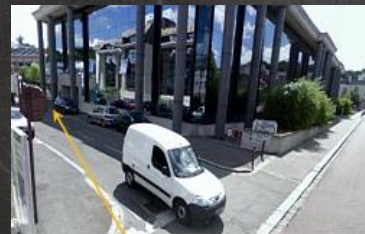
accès C.I.O. au fond de l'impasse