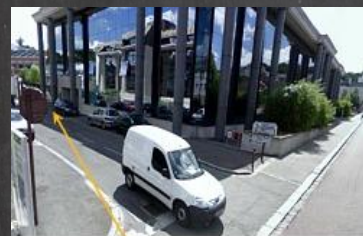
accès C.I.O. au fond de l'impasse

Du lundi au vendredi 9h00 - 12h30 13h30 - 17h00 Les mardi et mercredi et jeudi jusqu'à 17h30.