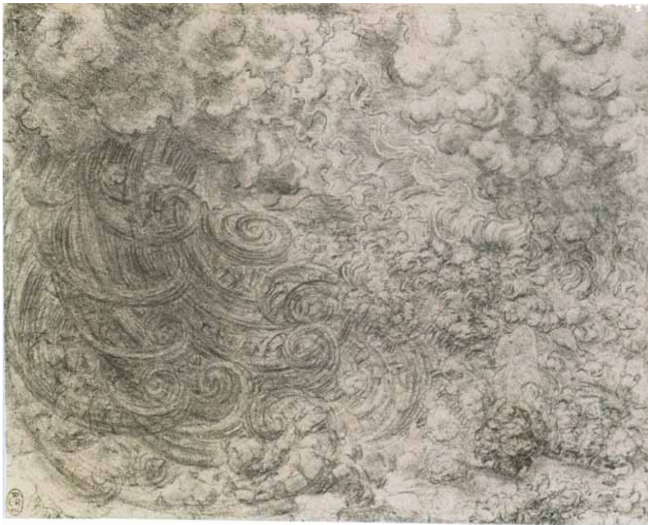
Document 2. Léonard de Vinci, « Déluge », vers 1517-1518, pierre noire, 16,5 x 20,4 cm, Windsor Castle, Royal Library.