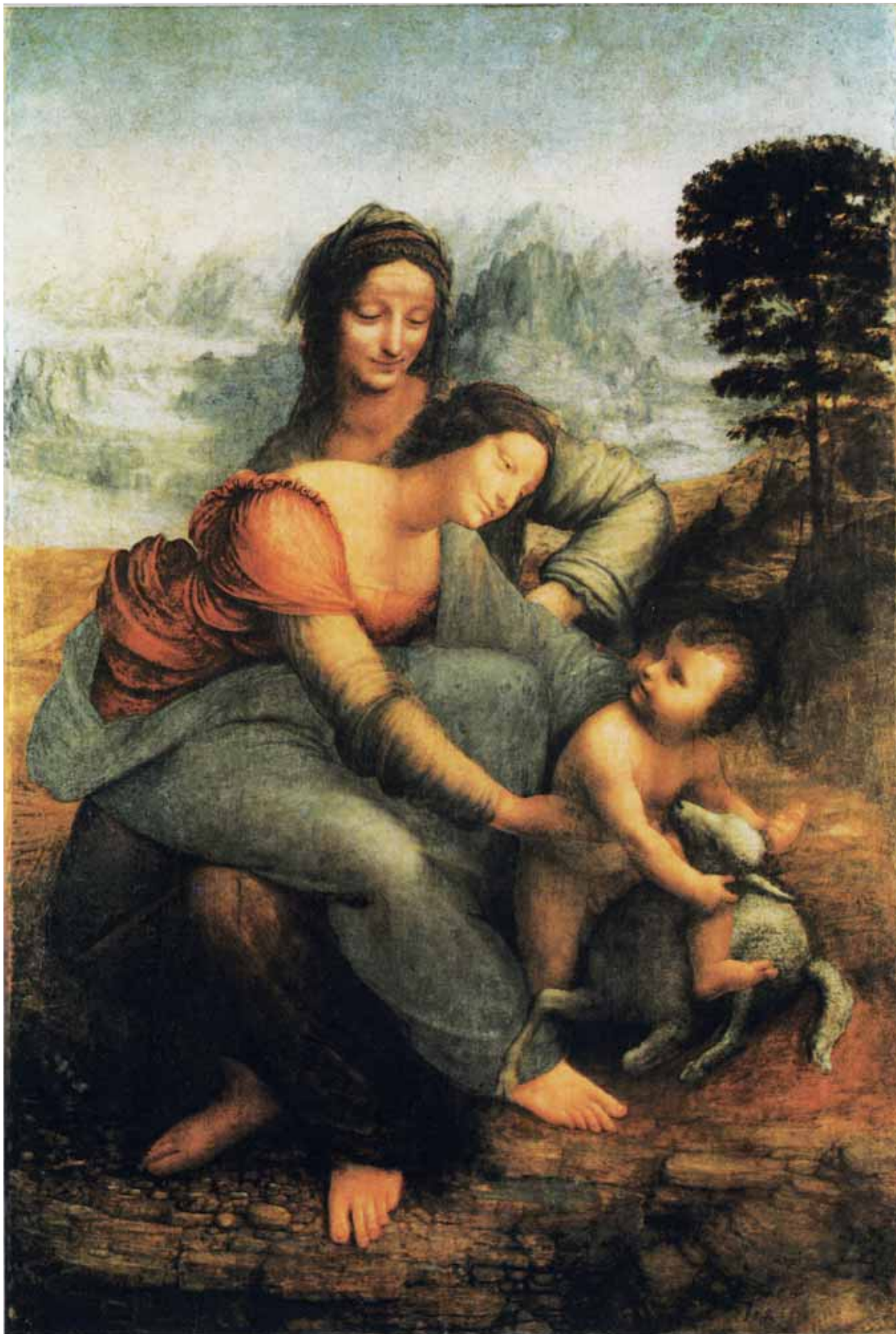
Document 3. Léonard de Vinci, « Sainte Anne, la Vierge et l'Enfant », à partir de 1506, huile sur bois, 168 x 130 cm, Paris, musée du Louvre.