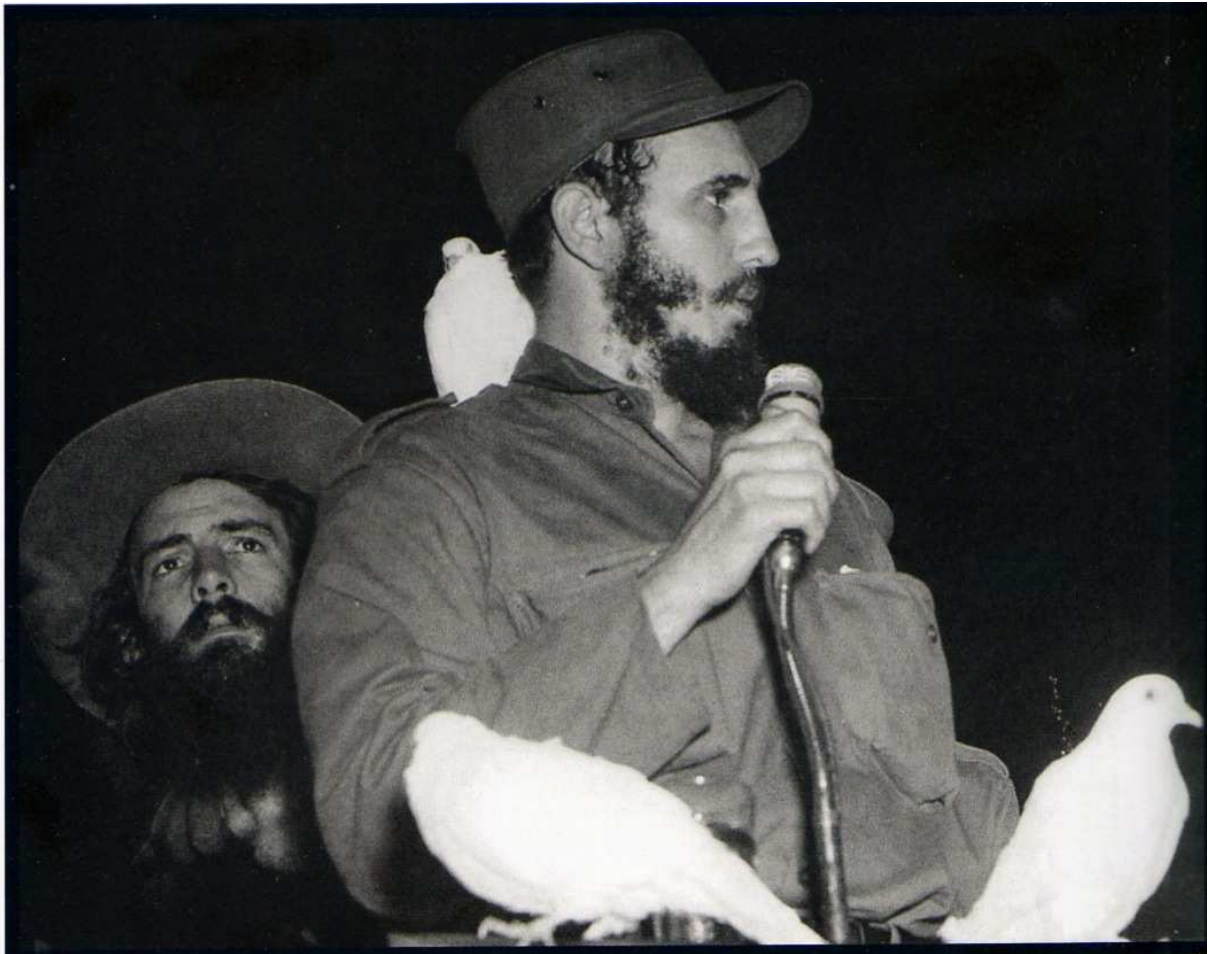
Fidel Castro pronunciando un discurso en el campo militar de Columbia después de su entrada en La Habana, el 8 de enero de 1959, durante el cual una paloma se posó en su hombro. A su lado, Camilo Cienfuegos.