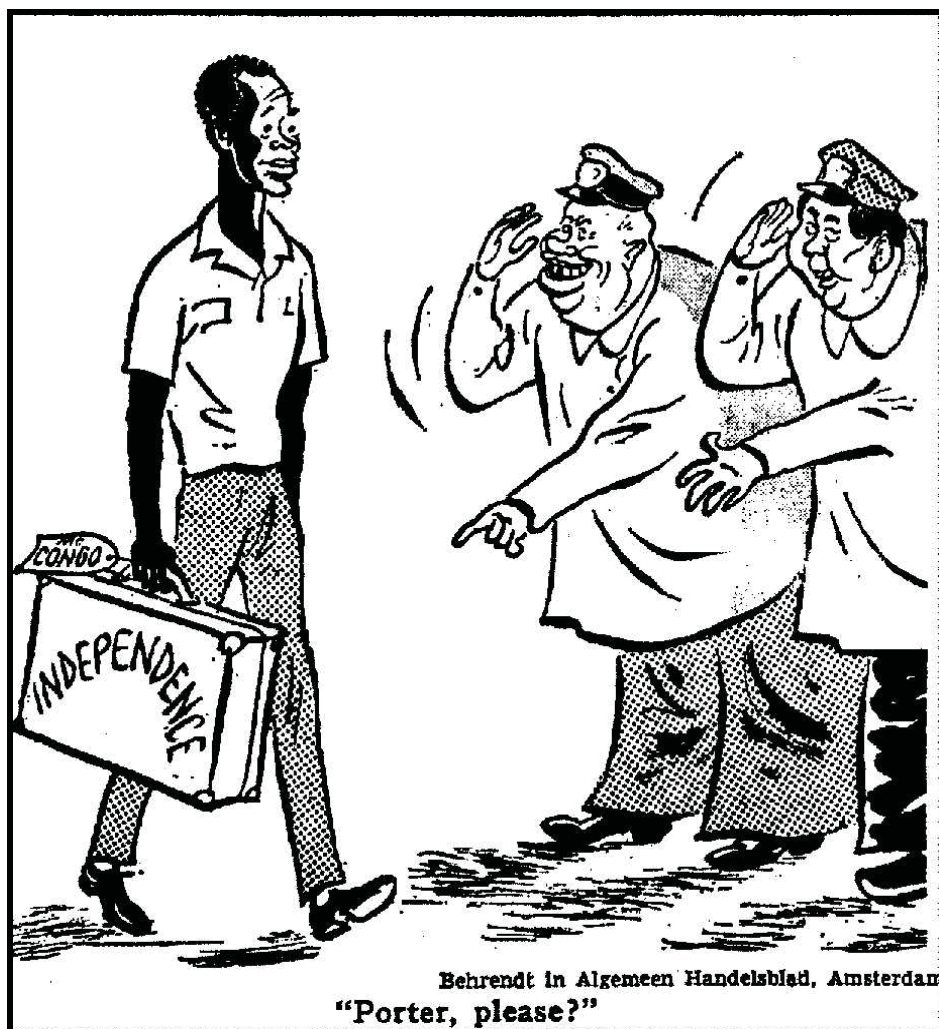
Document 2. Caricature publiée dans le New York Times , 10 juillet 1960.

Note : Nikita Khrouchtchev et Mao Zedong disent à Patrice Lumumba « Porteur, s'il vous plaît ? ».