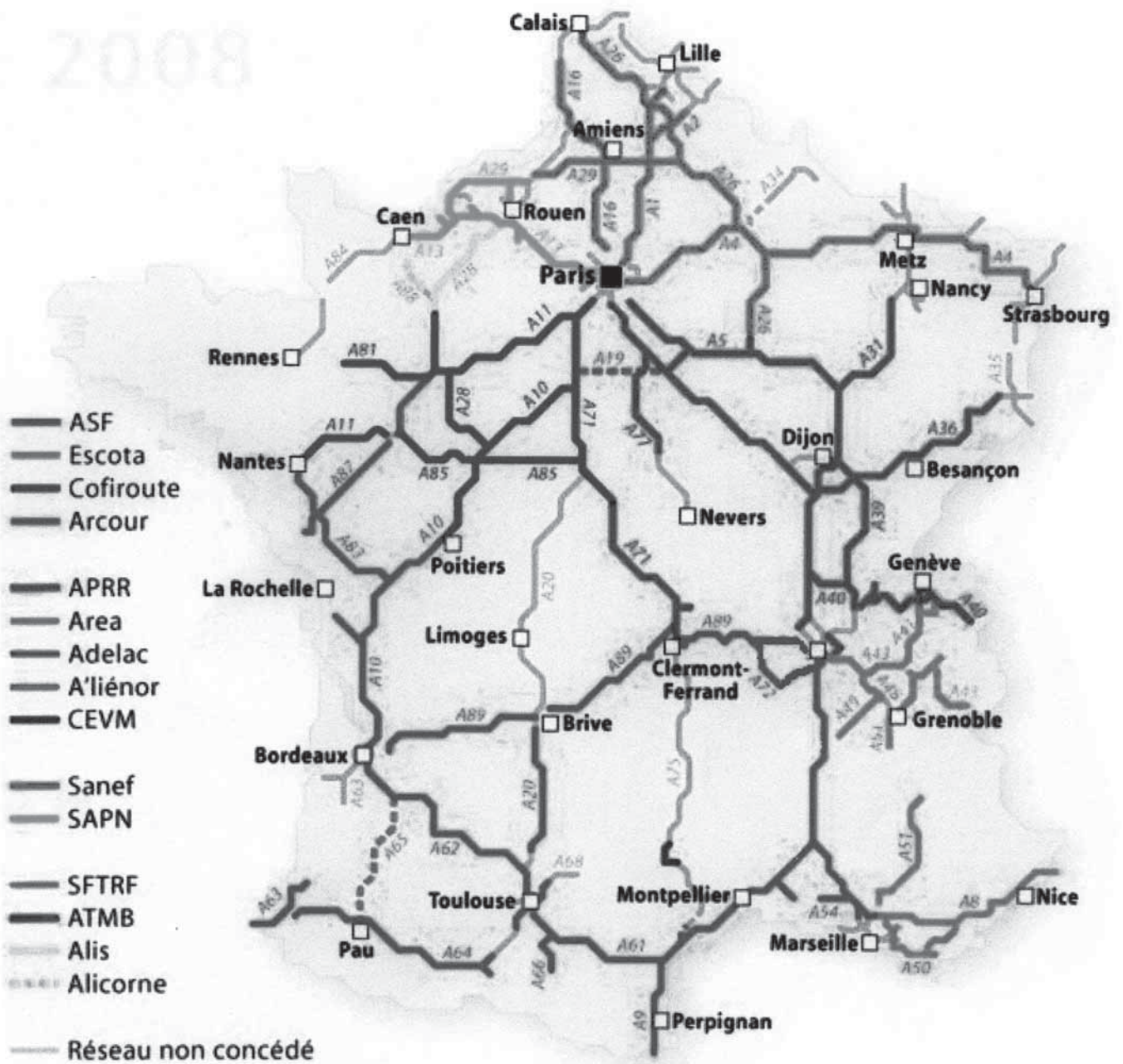
Carte de France