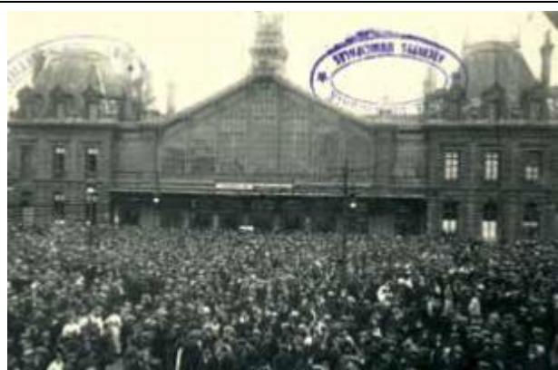
La place de la gare le 3 août 1914, jour de la mobilisation.