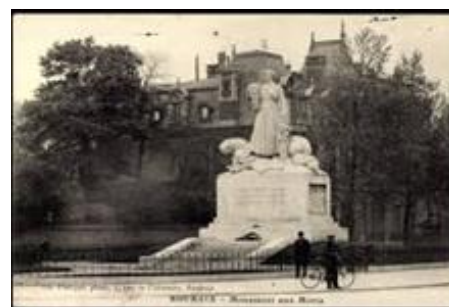
Le monument aux morts de Roubaix.

" Parce que l'histoire, ce sont des hommes et non des dates" comme l'affirme Antoine Prost (Journées de l'Histoire, Blois 2013), des destins roubaisiens, des lieux emblématiques et incarnés pourront permettre d'appréhender la Grande Guerre par le prisme de l'occupation singulière d'une ville « tombée en territoire ennemi ». Une famille d'industriels dans la guerre, les Motte, sera une porte d'entrée pour ce parcours historique au cœur d'un Roubaix profondément meurtri, tant physiquement qu'économiquement et socialement durant près de cinq longues années.