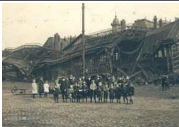
La gare de Roubaix détruite en 1918.