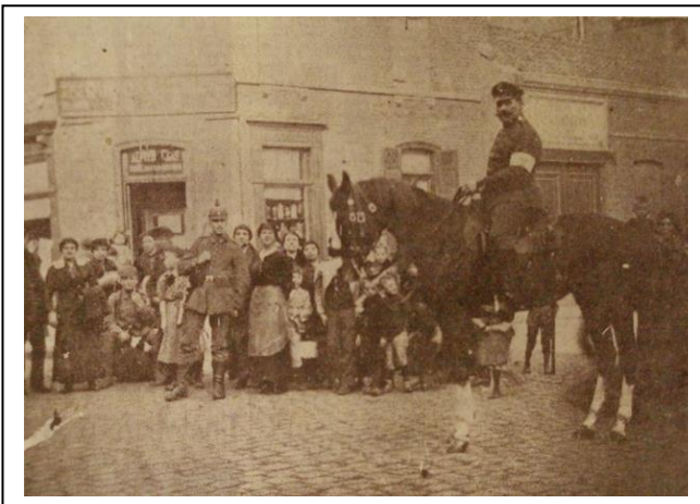
Roubaix occupée par les allemands, ici au Pile.