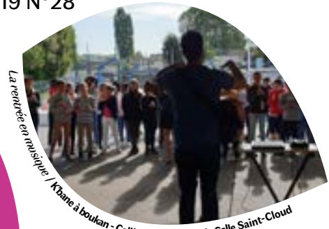
La rentrée en musique / Khane à boukan - Collège Victor Hugo, la Celle Saint-Cloud

Les orientations académiques pour l'Éducation artistique et culturelle sont fixées pour l'année 2019 - 2020. Vous trouverez la circulaire accompagnée de ses fiches techniques qui précisent les modalités d'appel à projets PACTE (Projet Artistique et Culturel en Territoire éducatif) et celles du recensement. Accéder à la circulaire et aux fiches techniques