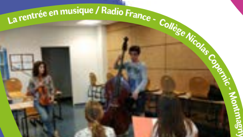
La rentrée en musique / Radio France - Collège Nicolas Copernic - Montigny

Les dispositifs « École et Cinéma », « Collège au Cinéma » et « Lycéens et Apprentis au Cinéma » permettent aux élèves de découvrir en salle trois oeuvres cinématographiques par an et de bénéficier d'un accompagnement pédagogique mené par les enseignants et les partenaires culturels. Information