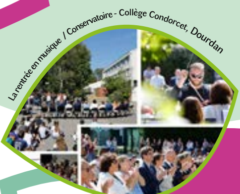
La rentrée en musique / Conservatoire - Collège Condorcet, Dourdan