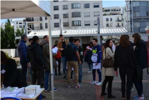
L'accueil des collégiens

Un bel évènement constructif qui a obtenu l'adhésion de tous.