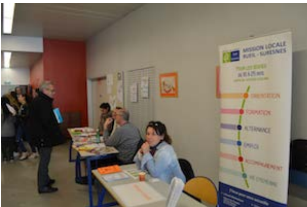
Mission Locale de Rueil -Suresnes