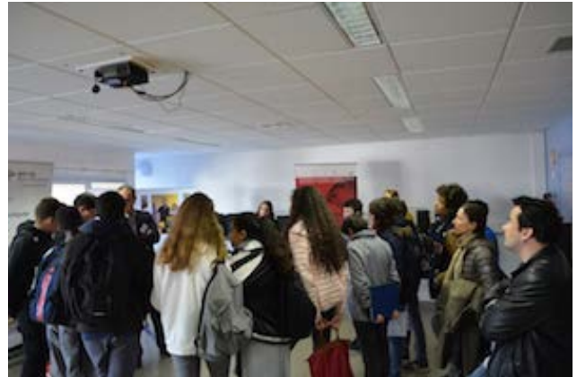
CFA du bâtiment de Rueil-Malmaison