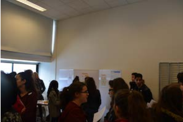
Lycée Gustave-Eiffel de Rueil-Malmaison