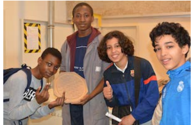
Menuiserie - Démonstration élèves Lycée Louis-Blériot de Suresnes (2)

Par madame Berjon-Bailly proviseure du lycée Louis-Blériot, Suresnes