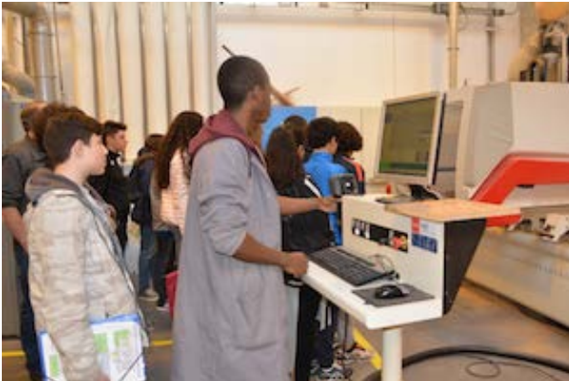
Menuiserie - Démonstration élèves Lycée Louis-Blériot de Suresnes (1)