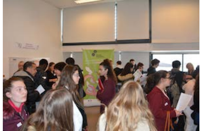
Lycée Claude-Garamont de Colombes