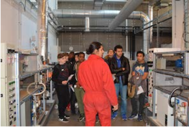
Énergétique - Démonstration élèves Lycée Louis-Blériot de Suresnes