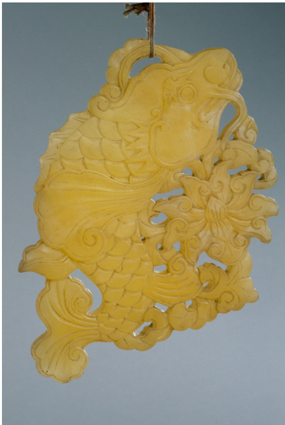
Pierre sonore "Qing", Anonyme, Chine, E.13