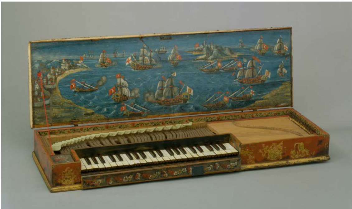
Clavicorde lié dit de "Lepante", anonyme, Italie, 16e, E.2111