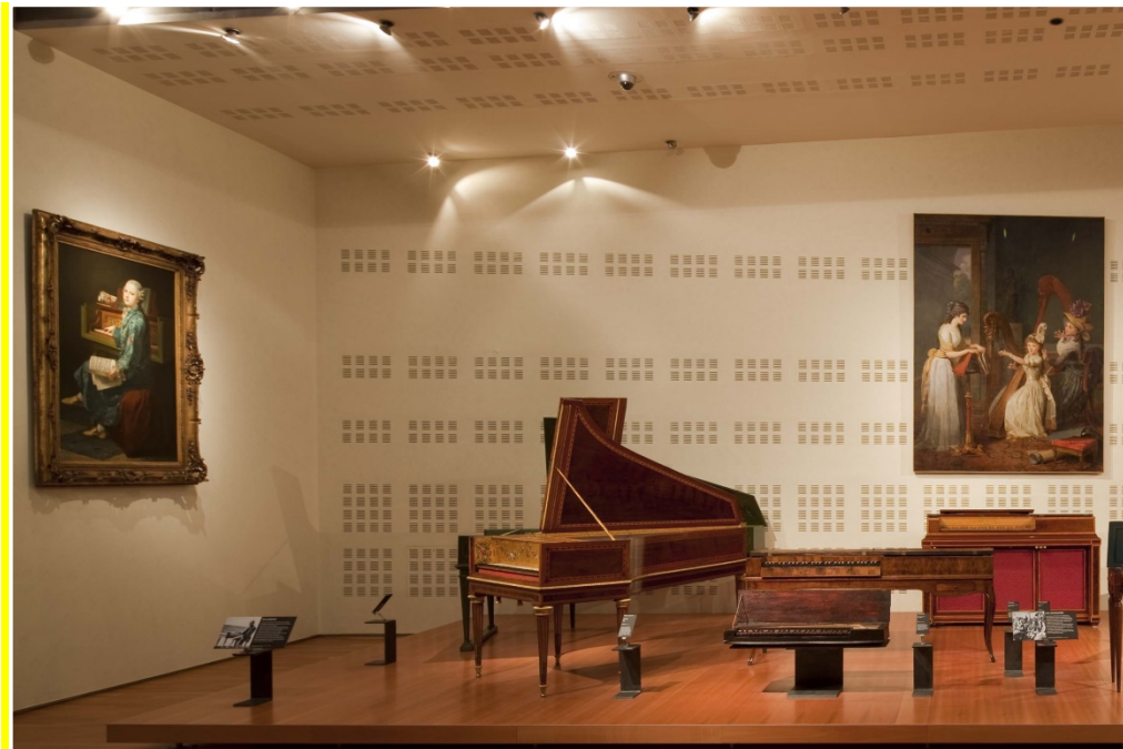
Musée de la musique - Plateau XVIIIe siècle