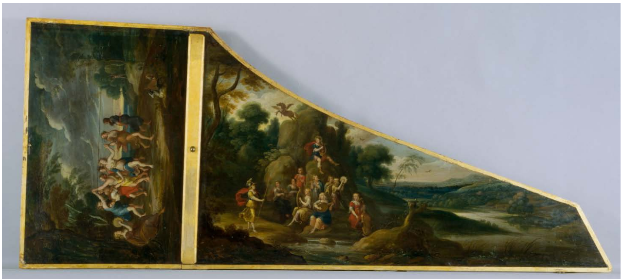
Clavecin, Ruckers (Andreas II), Anvers, 1646, ravalé par Taskin (Pascal-Joseph), Paris, 1780, E.979.2.1