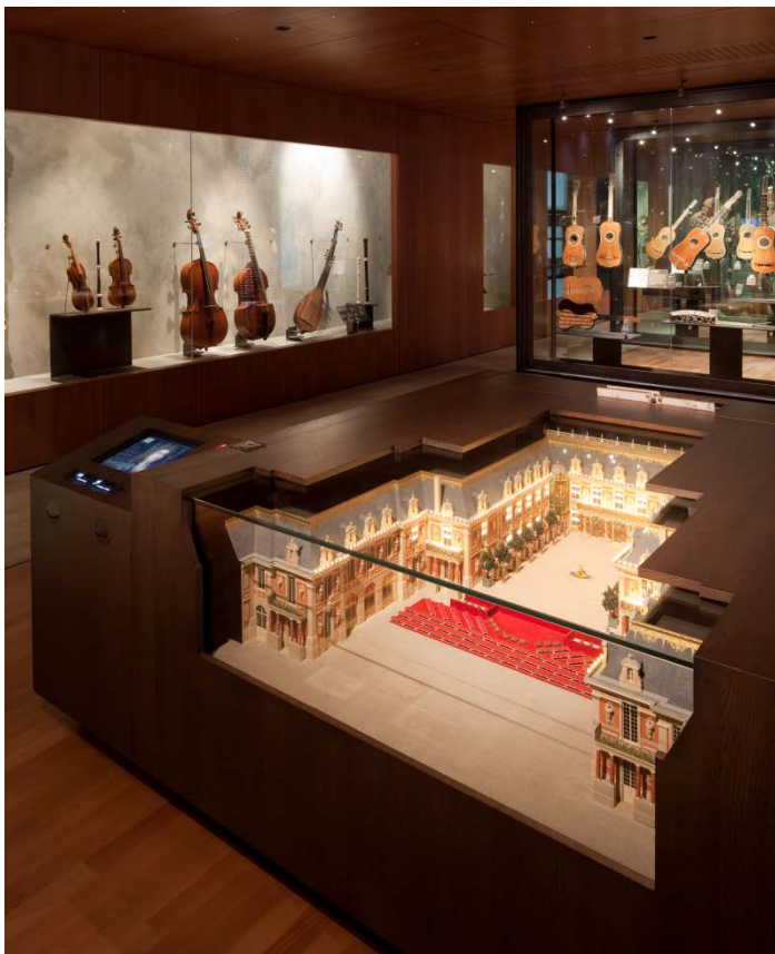
Musée de la musique, plateau XVII e , Maquette de la cour de marbre du château de Versailles © Nicolas Borel