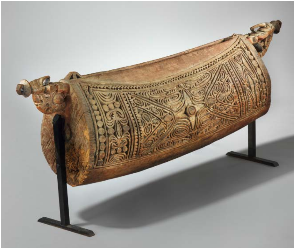
Tambour à fente "garamut", anonyme, Sepik, Papouasie-Nouvelle Guinée Fin 19ème ou début 20ème, E.2005.1.1