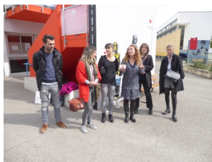
L'artiste et les professeurs