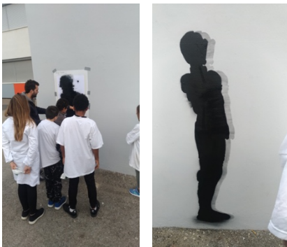
Début de la première peinture au pochoir

Au début de chaque séance, les groupes s'organisent en fonctions des tâches à effectuer. À tour de rôle, les élèves découpent les pochoirs et vont peindre à l'aérosol avec l'artiste. Les groupes alternent avec la professeure en salle d'arts plastiques et avec l'artiste à l'extérieur.