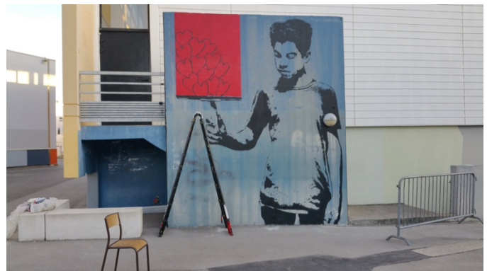
La deuxième peinture presque achevée

En janvier, une autoévaluation est proposée aux élèves restés en classe tandis que l'autre groupe commence la réalisation de la deuxième peinture.