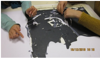
Découpe des pochoirs

Pour le projet de la deuxième peinture murale, SUNRA a déjà son idée. Il photographie des élèves pour servir de modèle au personnage nettoyant le mur sali par le temps avec une raclette à vitre, laissant apparaître un monde de cœurs.