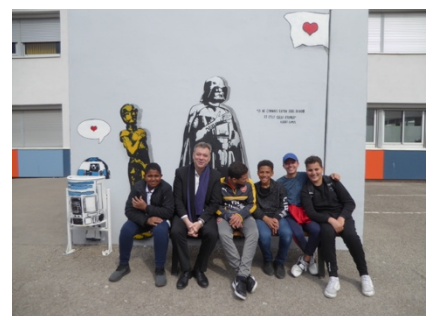
Le Principal du collège, et des élèves de l'atelier