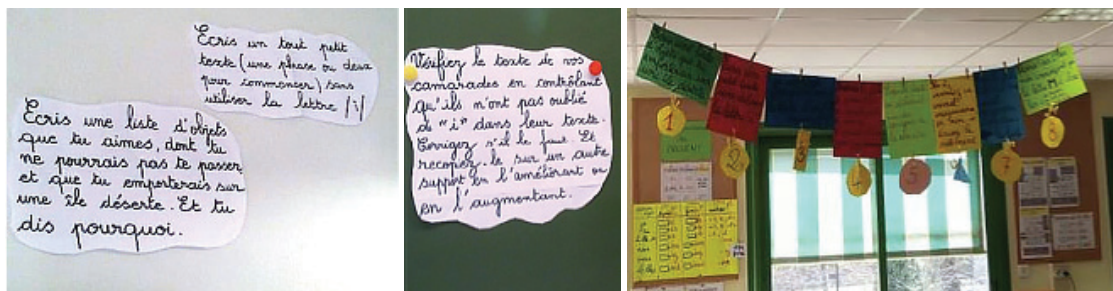
Affichage des consignes d'écriture

Les consignes sont courtes, et définies en sorte que l'élève puisse s'engager rapidement et sans difficulté. La présentation de la consigne et la gestion du temps doivent être rythmées pour maintenir une efficacité de l'activité. La ritualisation facilite l'entrée dans l'activité (même format et/ou même horaire).