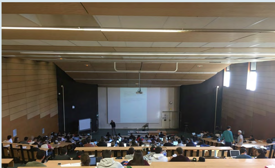
Un cours en amphithéâtre