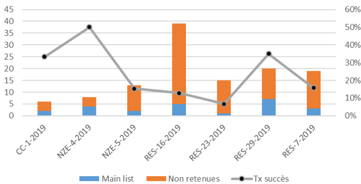
Participations et tx de succès/topic - France

Résultats des français vs résultats tous participants