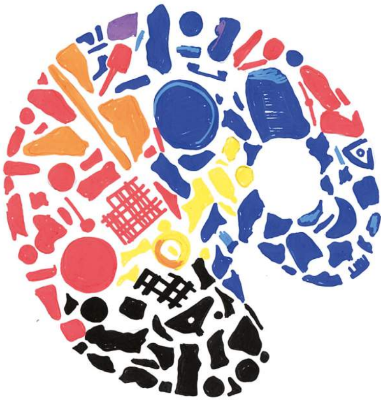
Tony Cragg, « Palette », reproduction

Ils passent ainsi du statut de reliques personnelles à celui de reliques universelles.