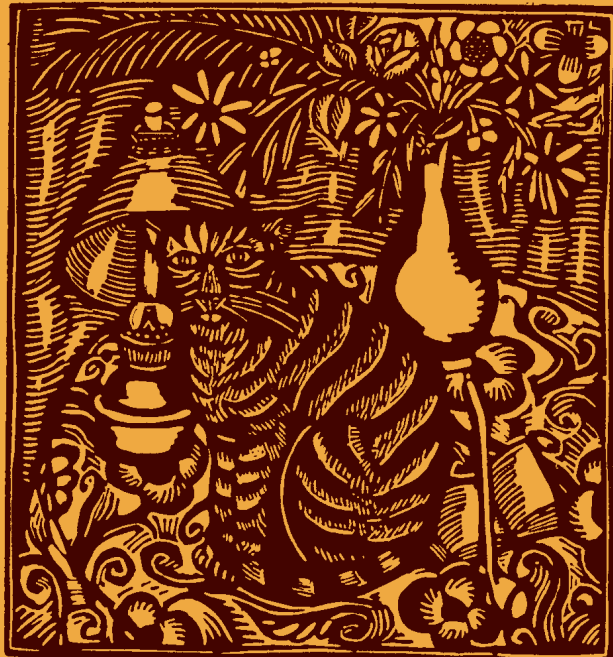
Apollinaire, Le Bestiaire ou cortège d'Orphée , 1911 Bois de Raoul Dufy

Je souhaite dans ma maison : Une femme ayant sa raison, Un chat passant parmi les livres, Des amis en toute saison Sans lesquels je ne peux pas vivre.