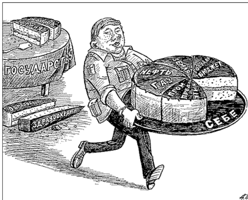
Рис. Анатолия Пономаренко (Нововоронеж) http://old.chubais.ru/humor/caricatures/page/9/