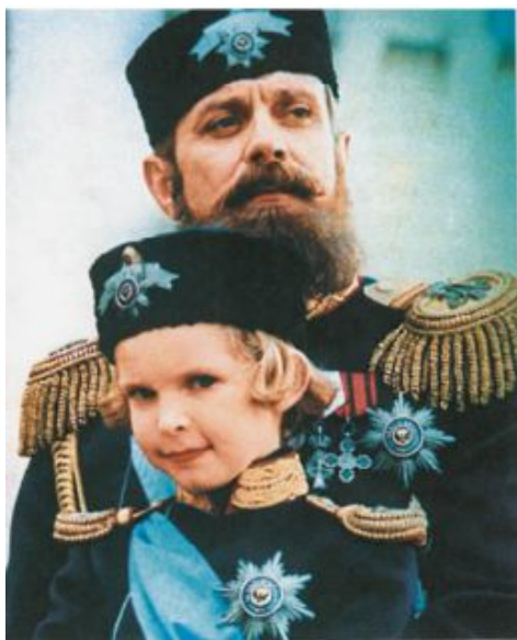
Никита Михалков – Александр III