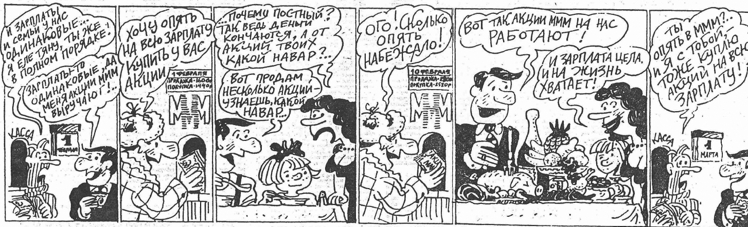
РОСТ СТОИМОСТИ АКЦИЙ АО "МММ" С 1 ФЕВРАЛЯ ПО 3 МАРТА 1994 ГОДА