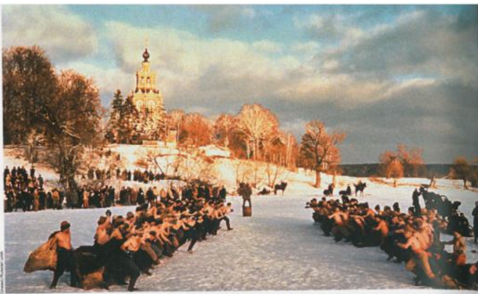
Кулачный бой у Новодевичьего монастыря