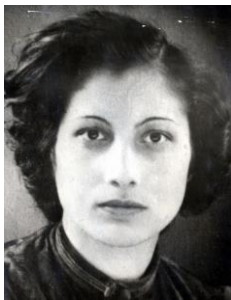
Noor Inayat Khan (1914 – 1944)

Après de longues années, je suis de retour en France. Mon nouvel appartement me paraît immense et je m'y perds parfois. De plus, je n'ai pas pris le temps de défaire tous mes cartons car le déménagement m'a épuisée. Ce soir encore, l'insomnie est venue me tenir compagnie ; alors je déambule à travers ce champ de cartons encore fermés.