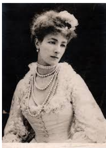
Sarah Bernhart (1844-1923)