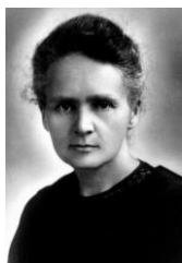
Marie Curie (1867-1934)