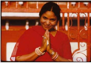
Phoolan Devi 1963 -2001